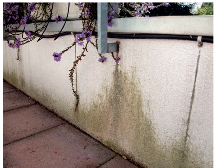
Biogener Bewuchs auf einer verputzten Wärmedämmung einer Terrassenbrüstung.