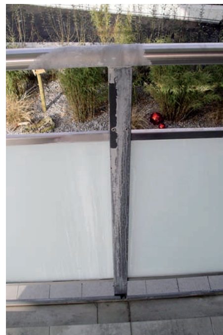
Kalkablagerungen an einem Chromstahlgeländer infolge von «Betonwasser», das durch Risse vom oberen Balkon tropft.

vom Gebäude weggeleitet, sind Feuchtigkeitsschäden am Sockel selten.