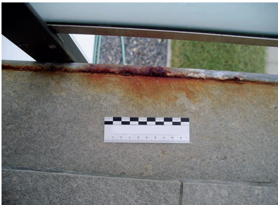
Korrosion an einem verzinkten und beschichteten Stahlrahmen am Anschluss an den Plattenbelag beim Brüstungsabschluss eines Balkons.