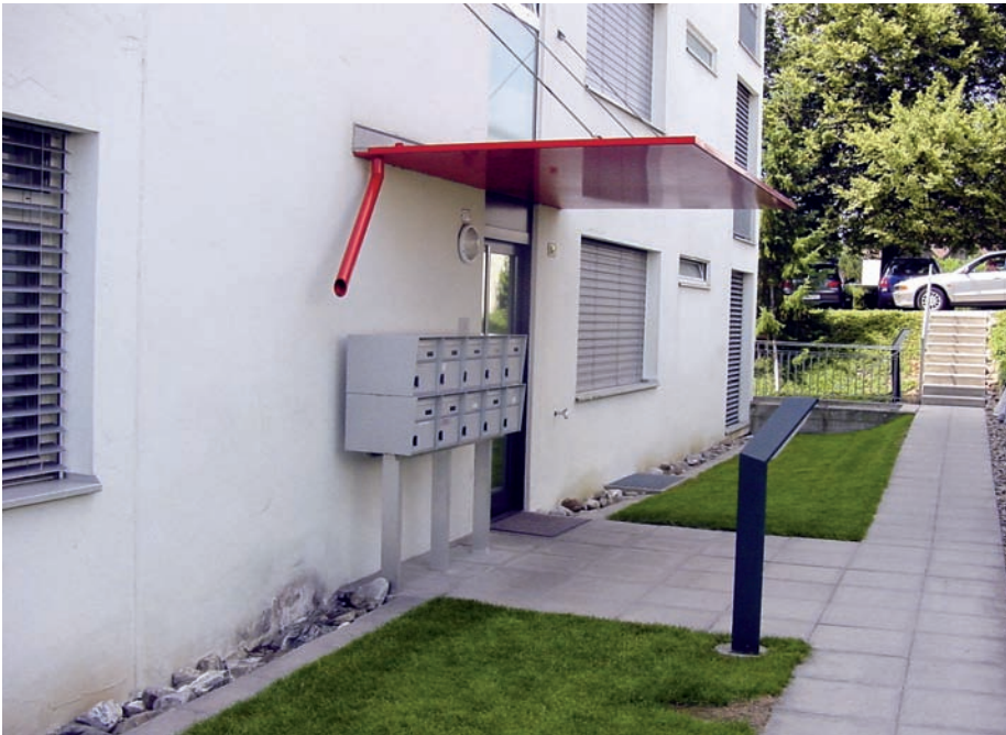
Das Regenwasser vom Vordach spritzt beim Aufprall auf dem Boden an die Hauswand und durchfeuchtet den Sockel der verputzten Aussenwärmedämmung.

dem gut entwässerten Verlegemörtel oder Splittbett gewährleistet zudem ein sofortiges Abfließen des eingedrungenen Wassers.